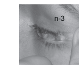
n-3 Extracción/Lens removal